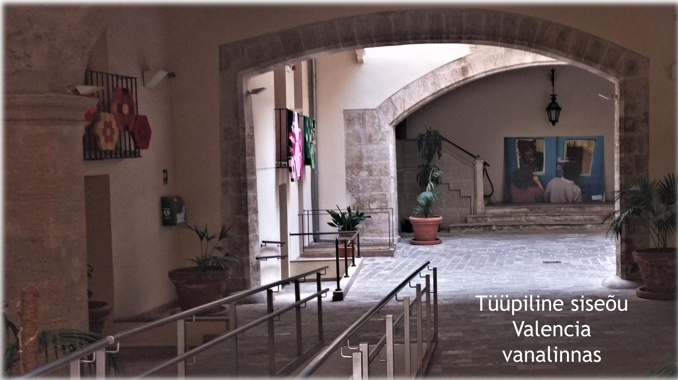
Tüüpile siseõu Valencia vanalinnas